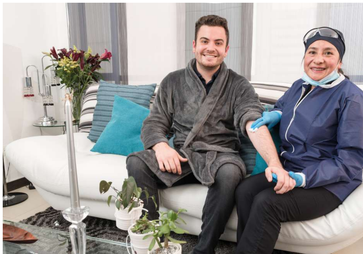
TOMA DE MUESTRAS A DOMICILIO GRATIS (Aplican T&C)