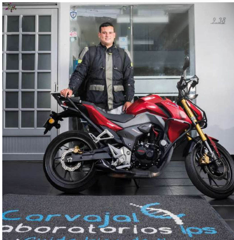
SERVICIO DE TRASLADO DE MUESTRAS PROPIO